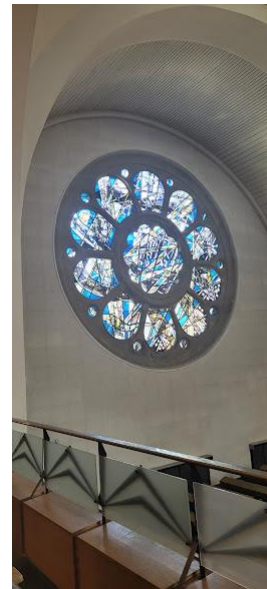
seitl. Fenster von Empore

An den Gebetstagen darf Jedermann/frau teilnehmen. Männer müssen eine Kopfbedeckung tragen und man sollte wissen, dass das Gebet am jiddischen Schabbes- Schabbat rund 3,5 Stunden dauert.